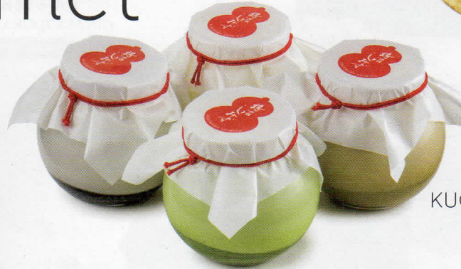
15 KUGENUMA SHIMIZU クゲヌマシミズ GINZA SIX 限定