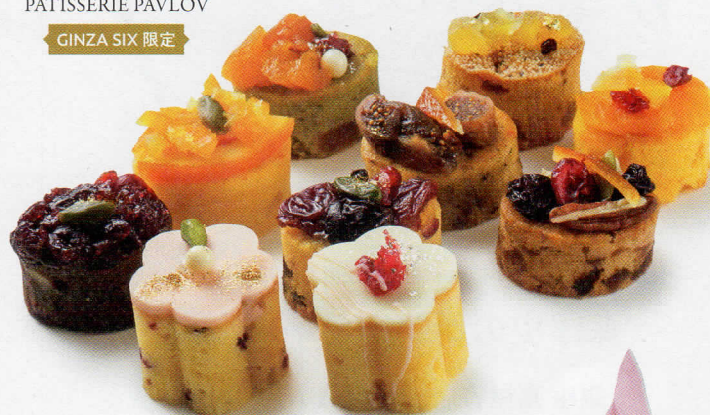
03 パティスリー パヴロフ PATISSERIE PAVLOV GINZA SIX 限定