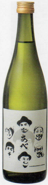
14 ふふふあん by 半兵衛麩 FUFUFU AND ... BY HANBEY-FU GINZA SIX 限定