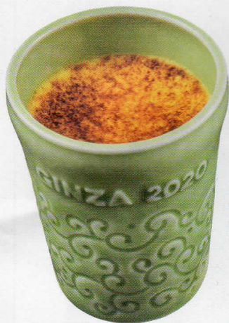
06 マールウ MARLOWE GINZA SIX 限定

03 華やかな彩りのパウンドケーキ詰め合わせ。ドライフルーツやナッツをふんだんに使用した限定ケーキ8種類と、レモンとローズが香る花型のケーキをセットに。一口サイズのころんとした見た目が愛らしい。〈フレイドールバリエ 16個入り〉3,704円。／パティスリー パヴロフ Tel.03-3289-7155【B2F】