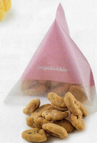
05 キャンディアートミュージアム by PAPA BUBBLE Gallery of Sweets Art by PAPA BUBBLE GINZA SIX 限定